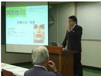
(余語先生によるご講演)