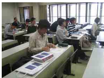
(講義をうける学生の皆さん)