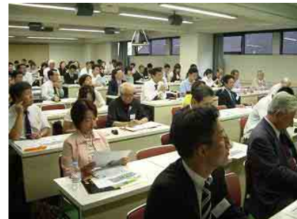
(熱心に聞き入る会場の様子)